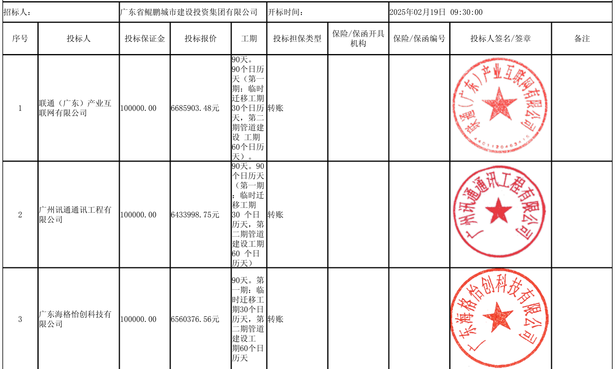
省道S537线(云安区段)细友石场至湾边村段改建工程-通信线路迁改项目 开标记录表