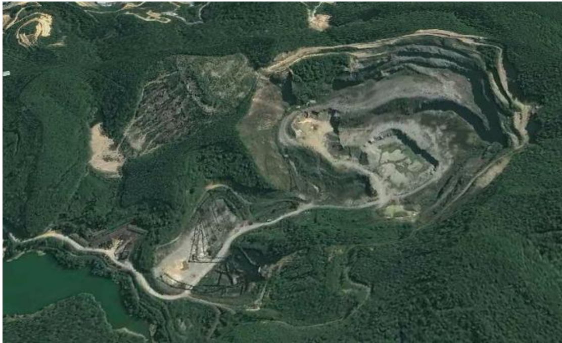
修复前鸟瞰图（3D 卫星影像）