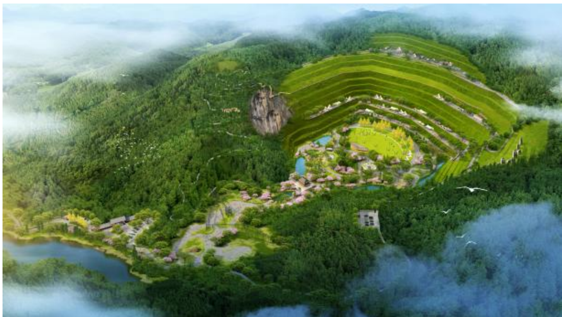
修复后鸟瞰图（效果图）