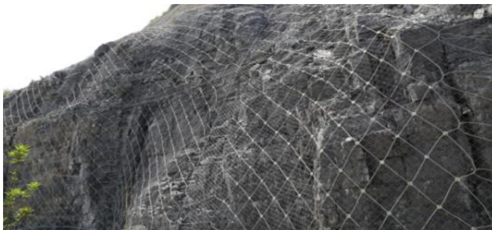
主动防护网示意图

锚杆施工安装完成后即可进行成品网片的安装、固定。成品网片直接采用吊车吊运到预定位置，从上向下铺挂，并利用网片上环孔等固定在钢结构上，钢结构与边坡锚杆间用钢丝绳锚杆连接固定。