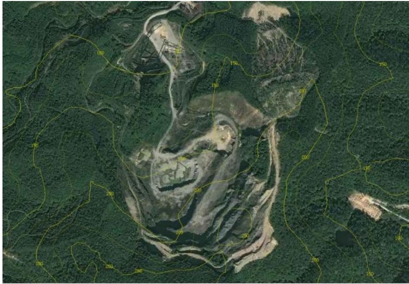
场地卫星图（等高线）

项目占地面积约 227320 m 2 ，合计约 340 亩。原矿址开采矿种为建筑用花岗岩矿，用地中心地理坐标：东经 112° 10' 48"，北纬 22° 41' 26.5"。属丘陵地貌，海拔高程一般为+74m~+298.0m，最大相对高差 224m，采区自上而下形成+175m、+167m、+145m、+130m、+115m 五个台阶，土层剥离台阶较陡，超过 50°；岩矿台阶坡面角在 70° 左右，其中 +167m、+130m、+115m 为主要采矿作业平台，采场底标高为+115m，采场底面积约 50000m 2 。