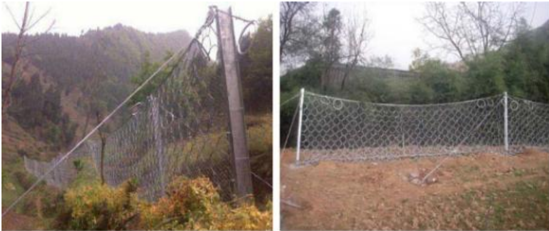
被动防护网示意图

挂网及网片、钢结构固定成品网片直接采用吊机吊运到规定的位置，从上向下铺挂，并利用网片上环孔等固定在钢结构上。钢结构与边坡锚杆间用钢丝绳锚杆连接固定。