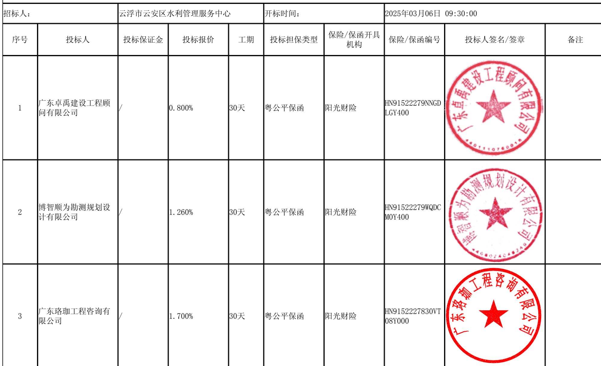
白石河云浮市云安区治理工程设计 开标记录表