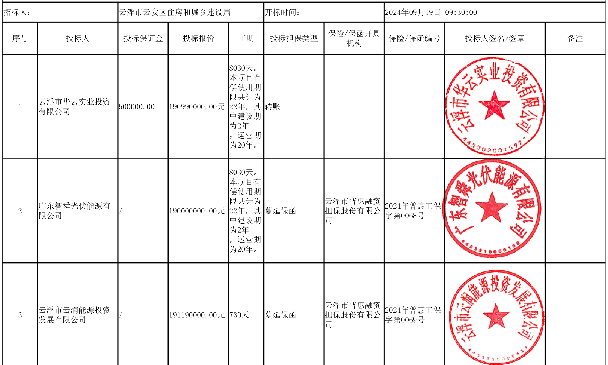
云安区城市公共区域停车泊位与新能源汽车充电基础设施有偿使用项目 开标记录表