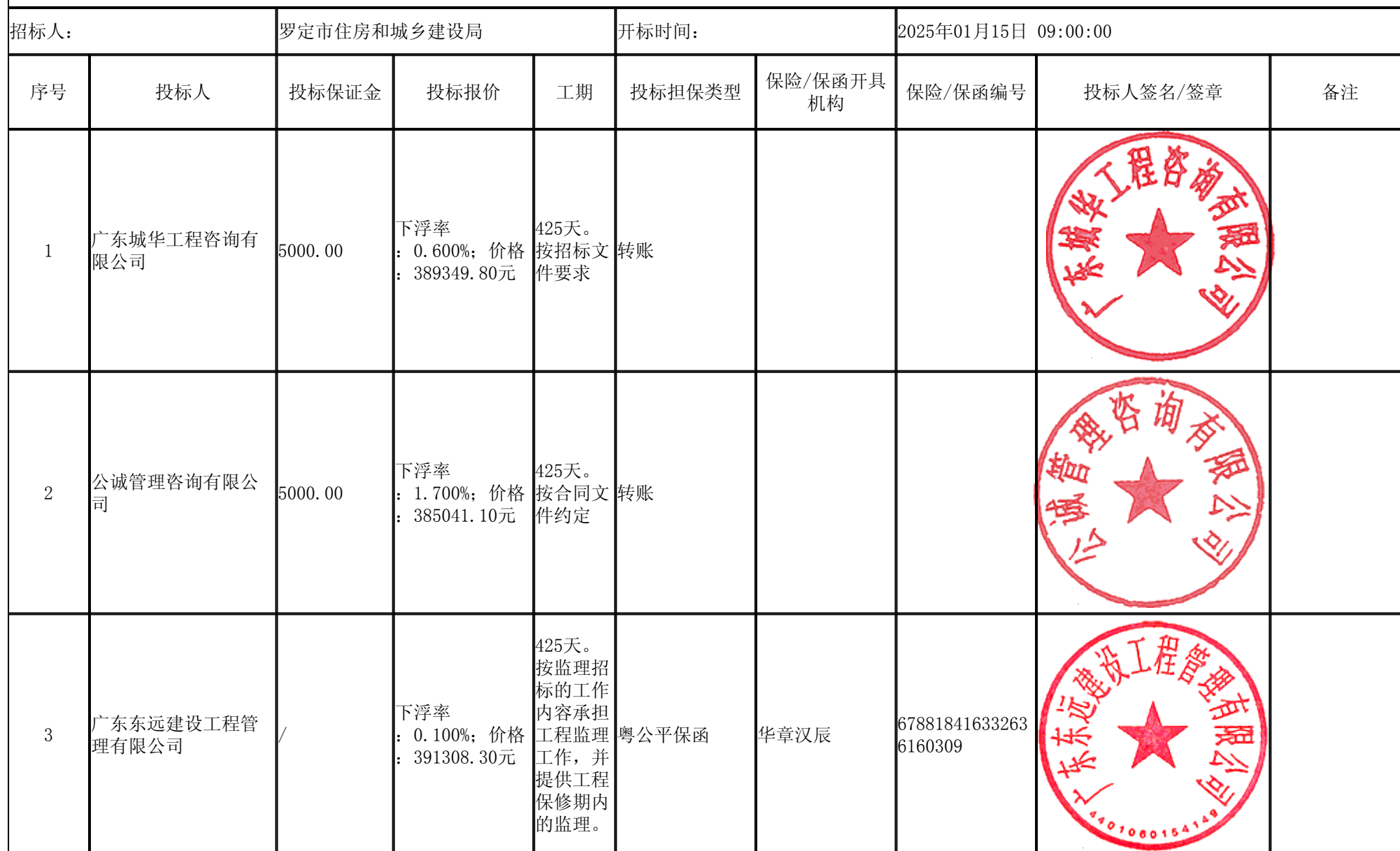
云浮市罗定市2022年城镇污水处理收集能力提升工程（三期）（第一标段）监理 开标记录表