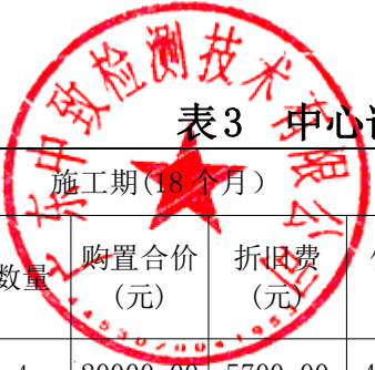
表3 中心试验室试验检测工程师办公设施费报价表