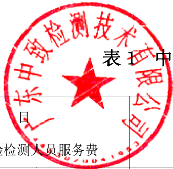
表 1 中心试验室试验检测服务费用报价汇总表