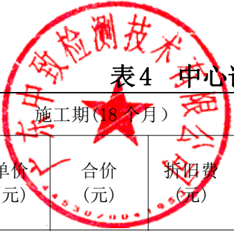
表4 中心试验室试验检测工程师交通设施费报价表