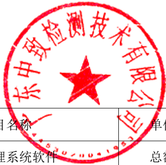
表7 其他费用报价表