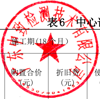
表6 中心试验室试验检测工程师生活设施费报价表