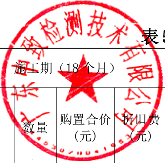
表5 中心试验室试验设施费报价表