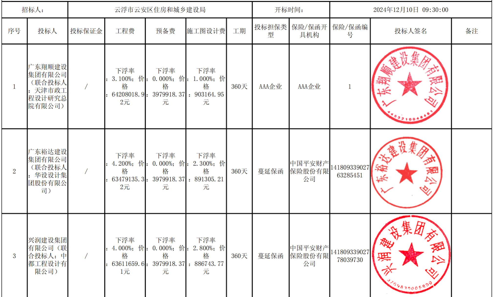
疏港大道建设工程一期（设计施工总承包） 开标记录表