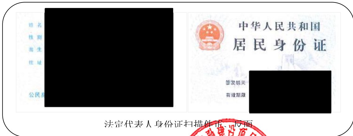
法定代表人身份证扫描件正、反面