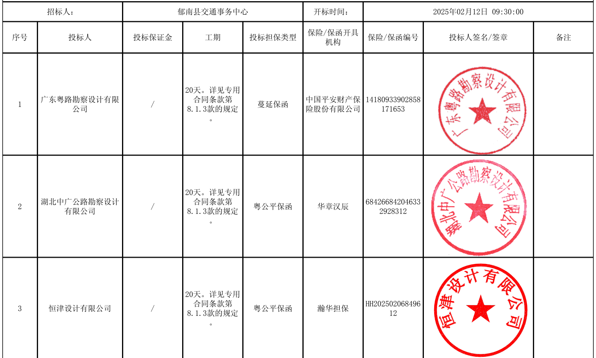
郁南县2024年农村公路建设项目库（第二批）（勘察设计） 开标记录表