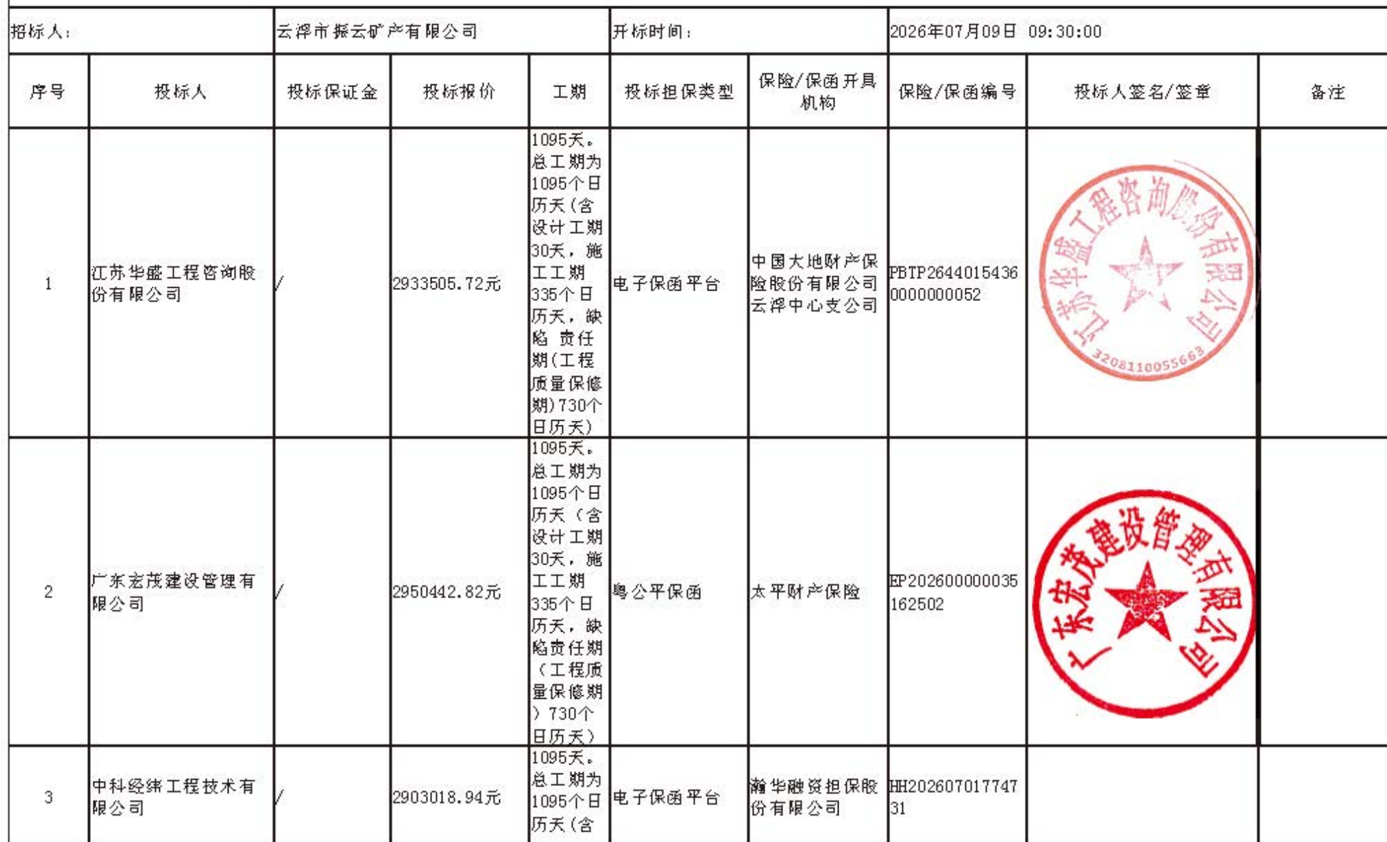
深南高铁云浮站综合交通枢纽配套工程监理 开标记录表