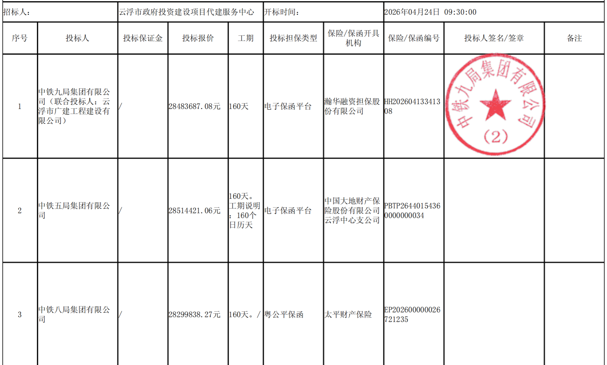
北师大云浮实验学校周边市政管网工程施工 开标记录表