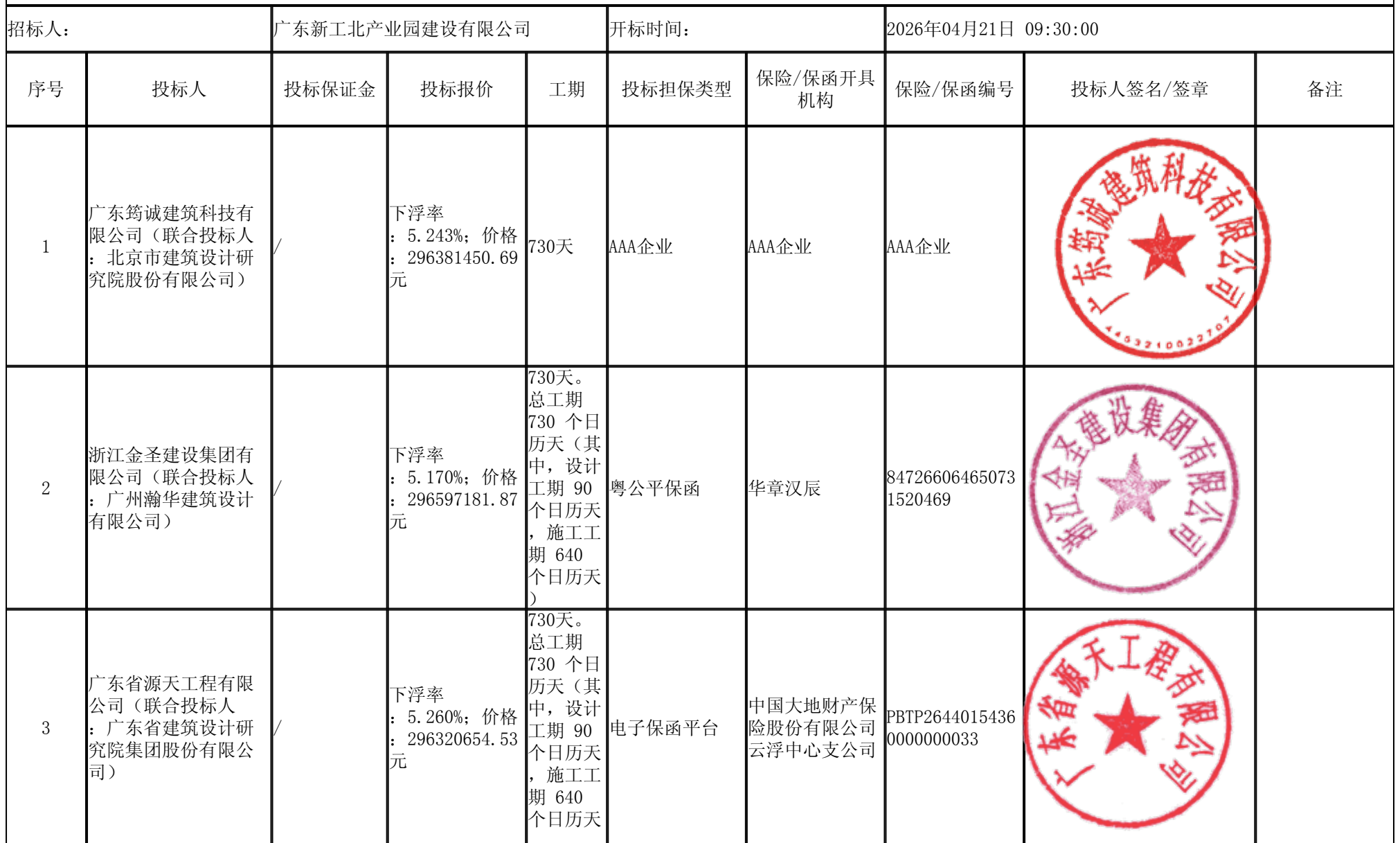
新兴县新成工业园北园标准厂房及配套项目设计施工总承包招标 开标记录表