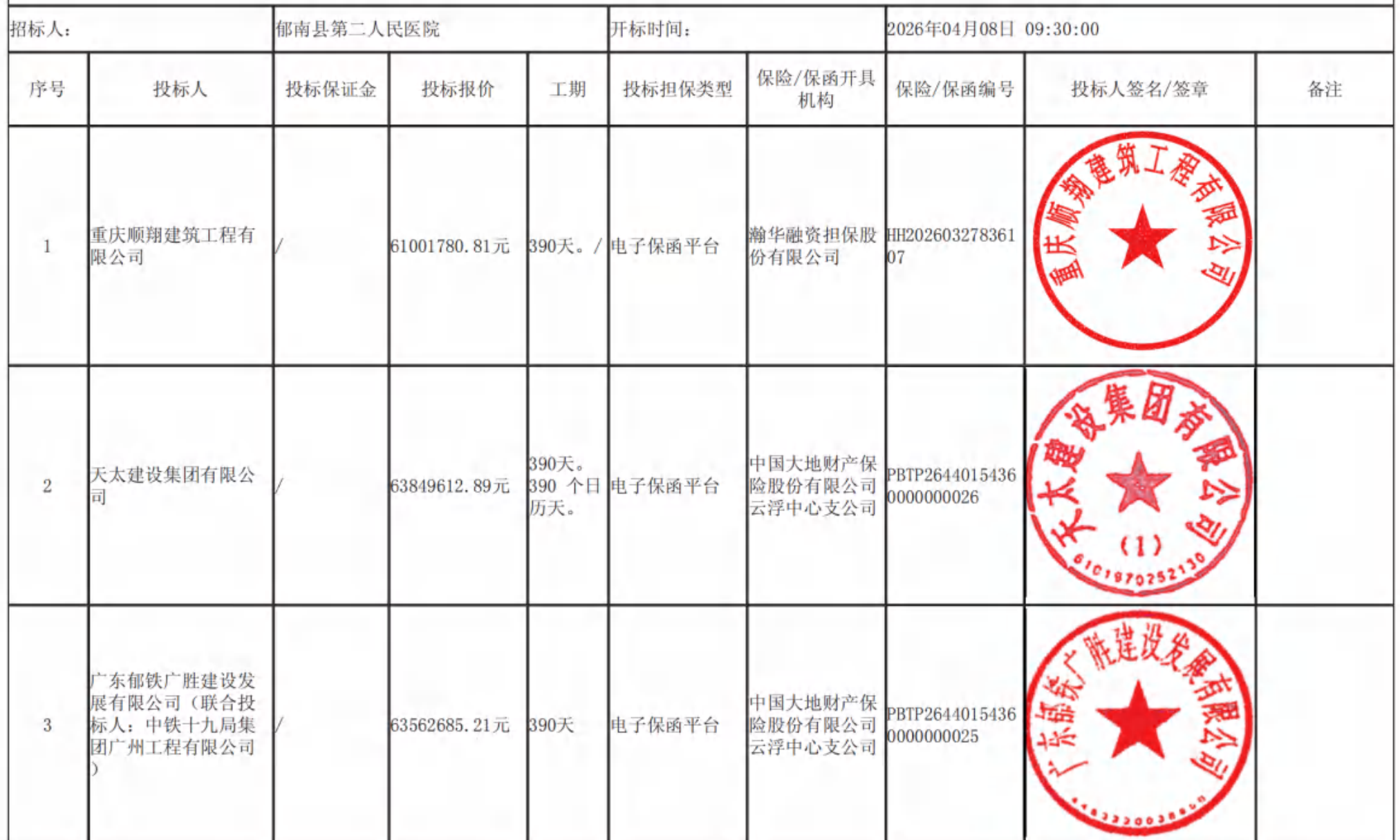
郁南县第二人民医院扩容提质增效建设项目（康复综合楼及周边配套设施建设项目）（施工） 开标记录表