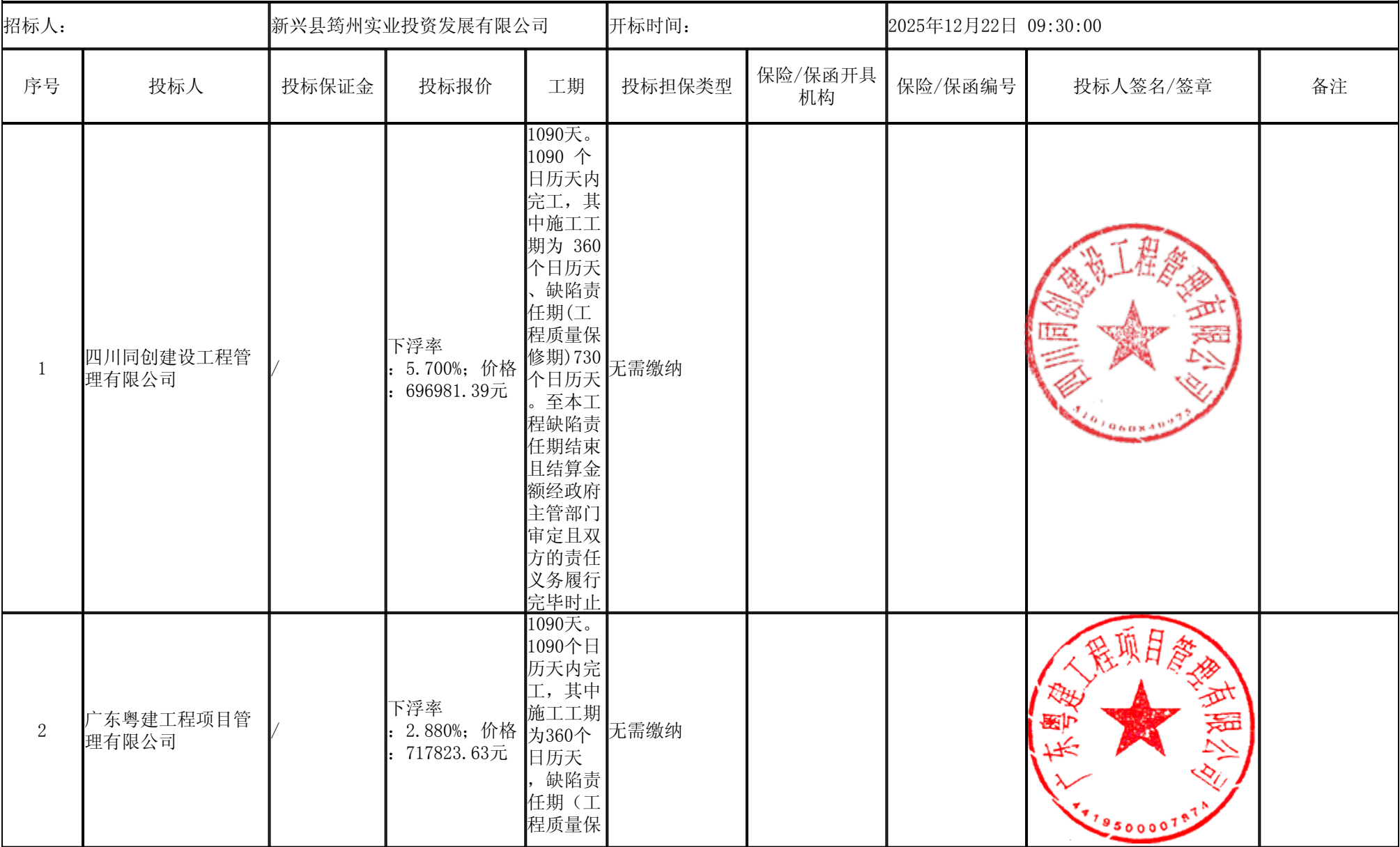
新兴县“百千万工程”典型镇人居环境综合整治项目—水台镇典型镇建设项目（监理） 开标记录表