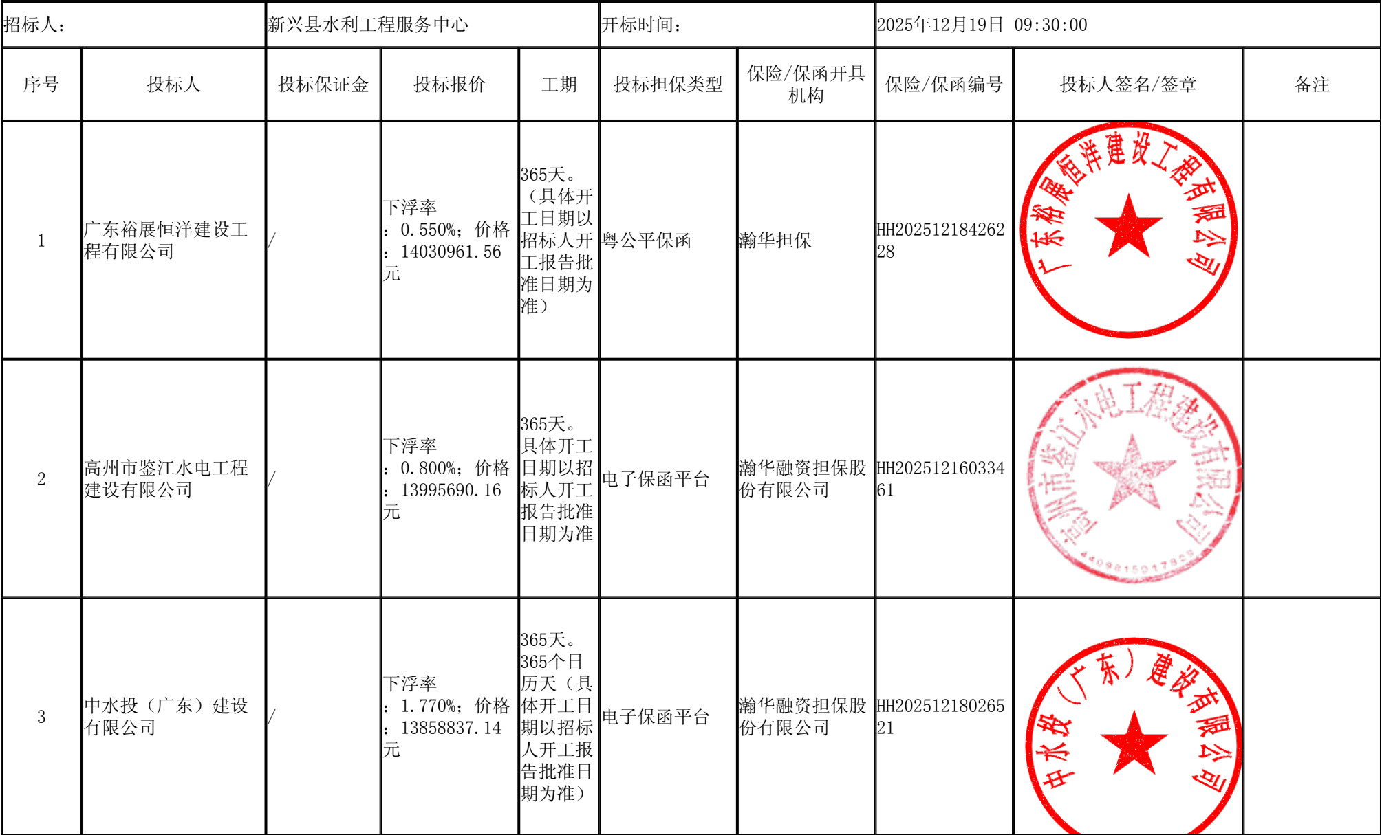
新兴县共成水库灌区节水改造工程（二标）施工 开标记录表