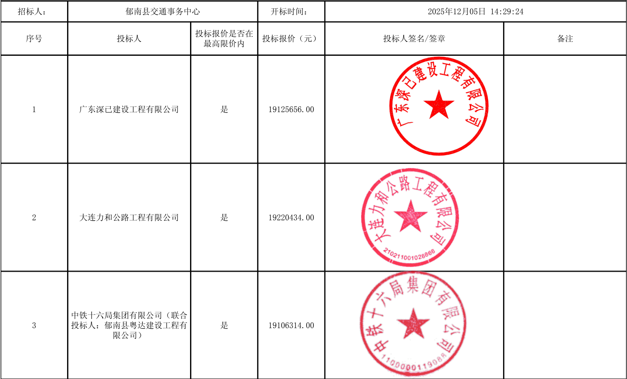
郁南县2025年农村公路建设项目库(第一批)施工 开标记录表（第二信封）