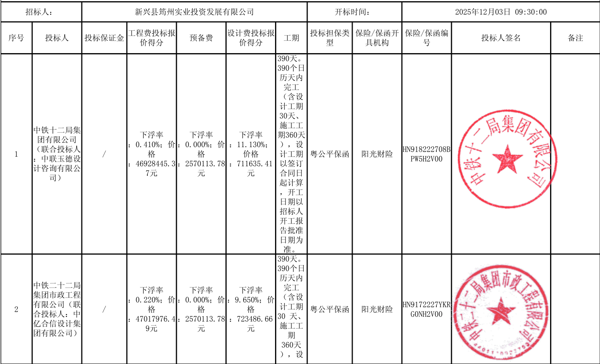
新兴县“百千万工程”典型镇人居环境综合整治项目一稔村镇典型镇建设项目（设计施工总承包） 开标记录表