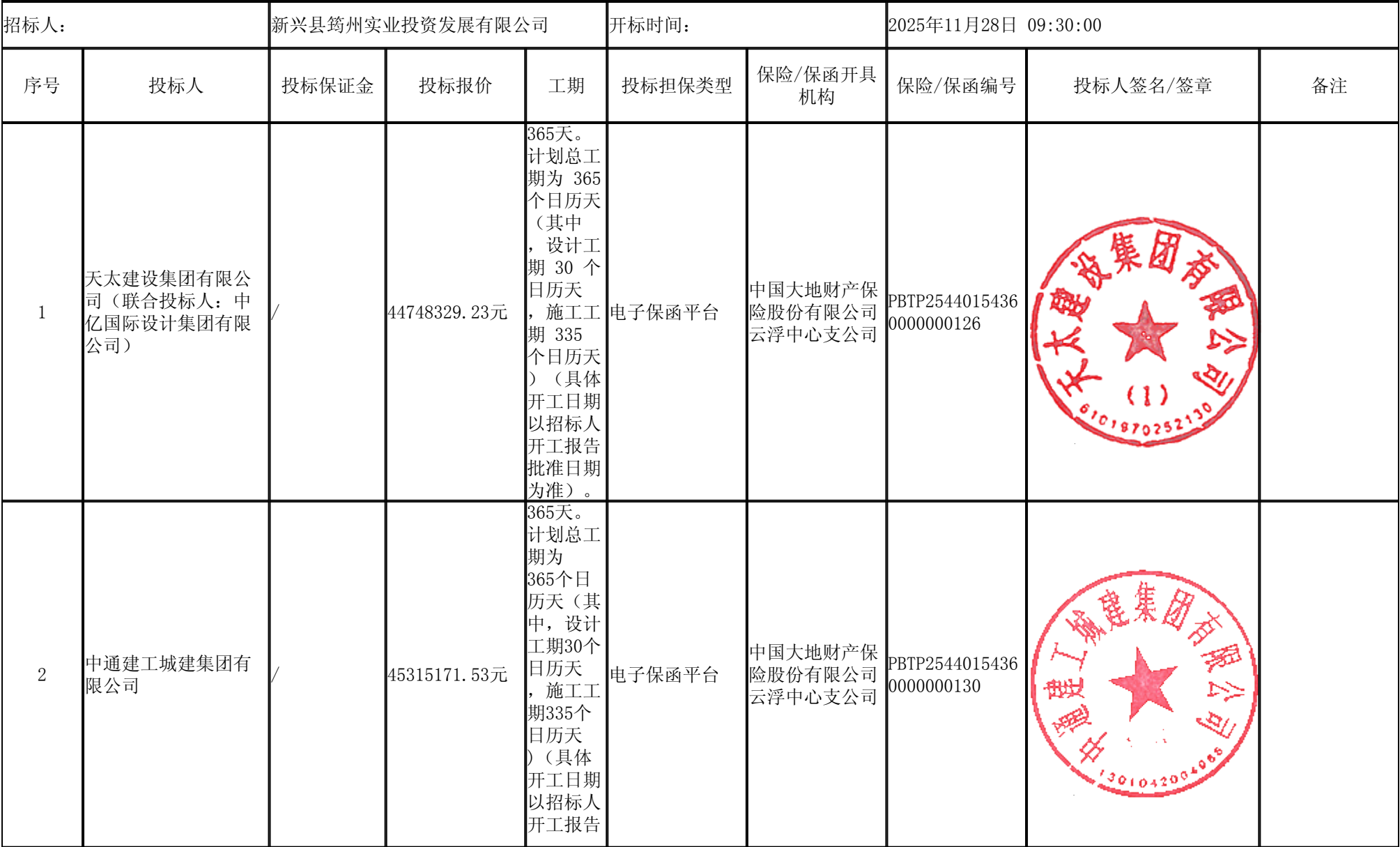
新兴县“百千万工程”典型镇人居环境综合整治项目一里洞镇典型镇建设项目设计施工总承包 开标记录表