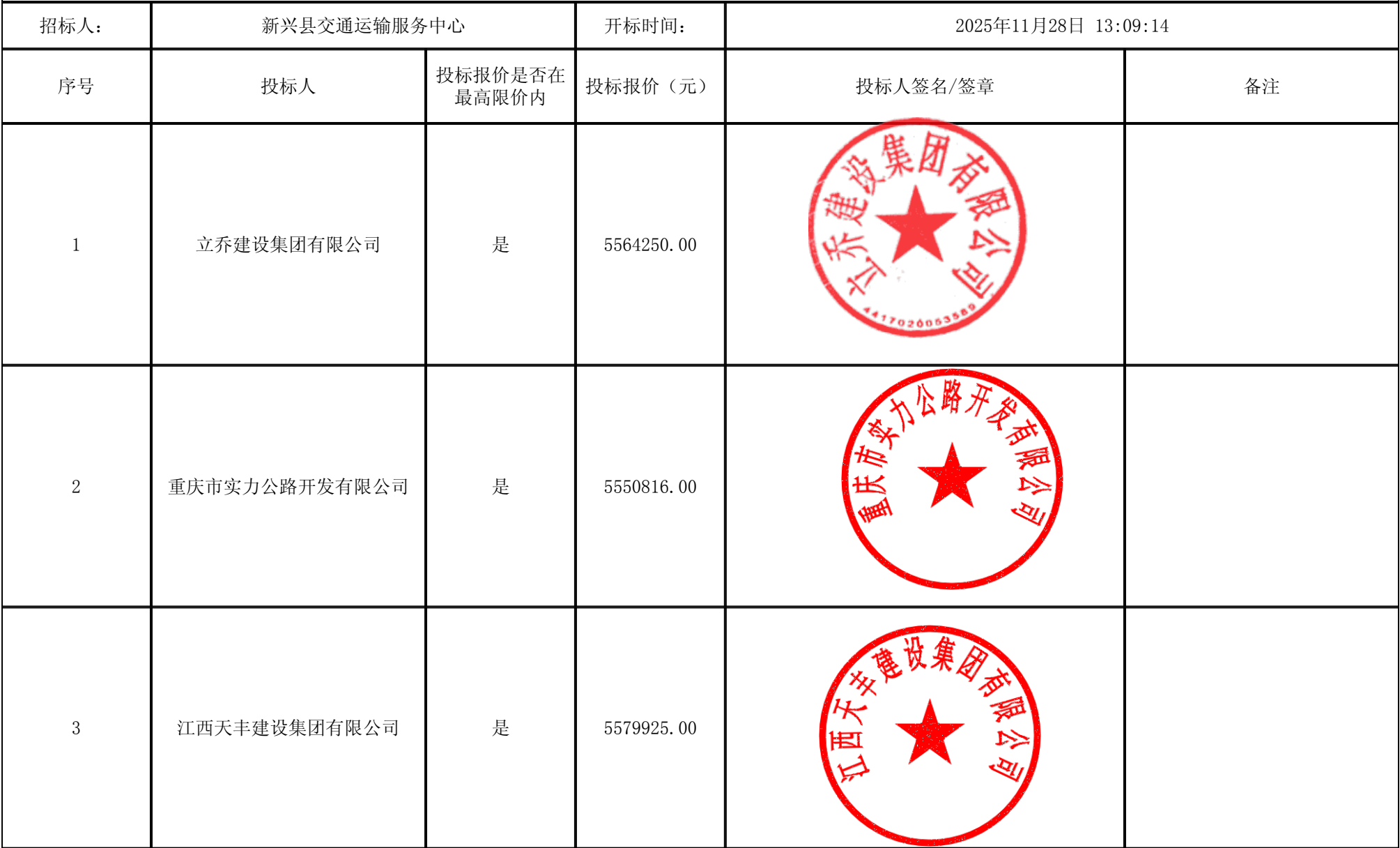
新兴县2025年通建制村单车道改双车道工程和村道安防工程（施工） 开标记录表（第二信封）