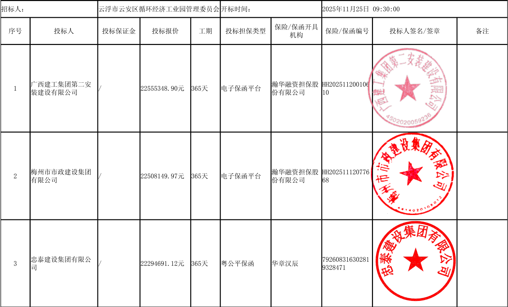
云浮循环经济工业园青洲大道消防救援站工程施工 开标记录表