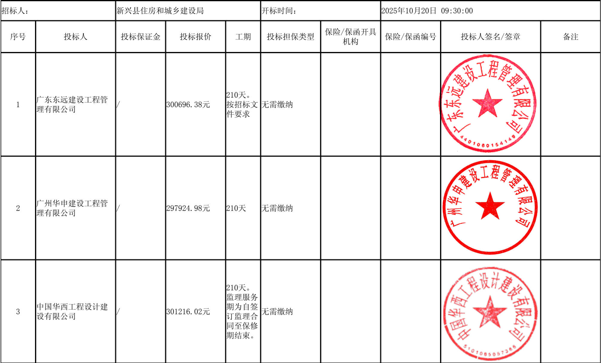
新兴县城区易涝点排水改造工程（广兴大道西文建路交汇路段）（监理） 开标记录表