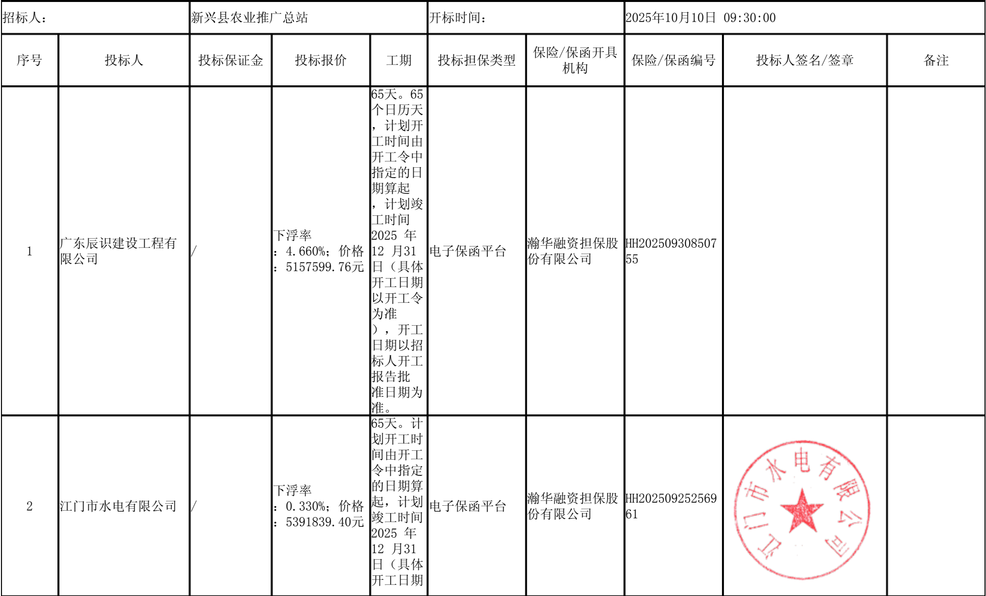
2025年度云浮市新兴县东成镇等2个镇高标准农田改造提升建设项目工程施工 开标记录表