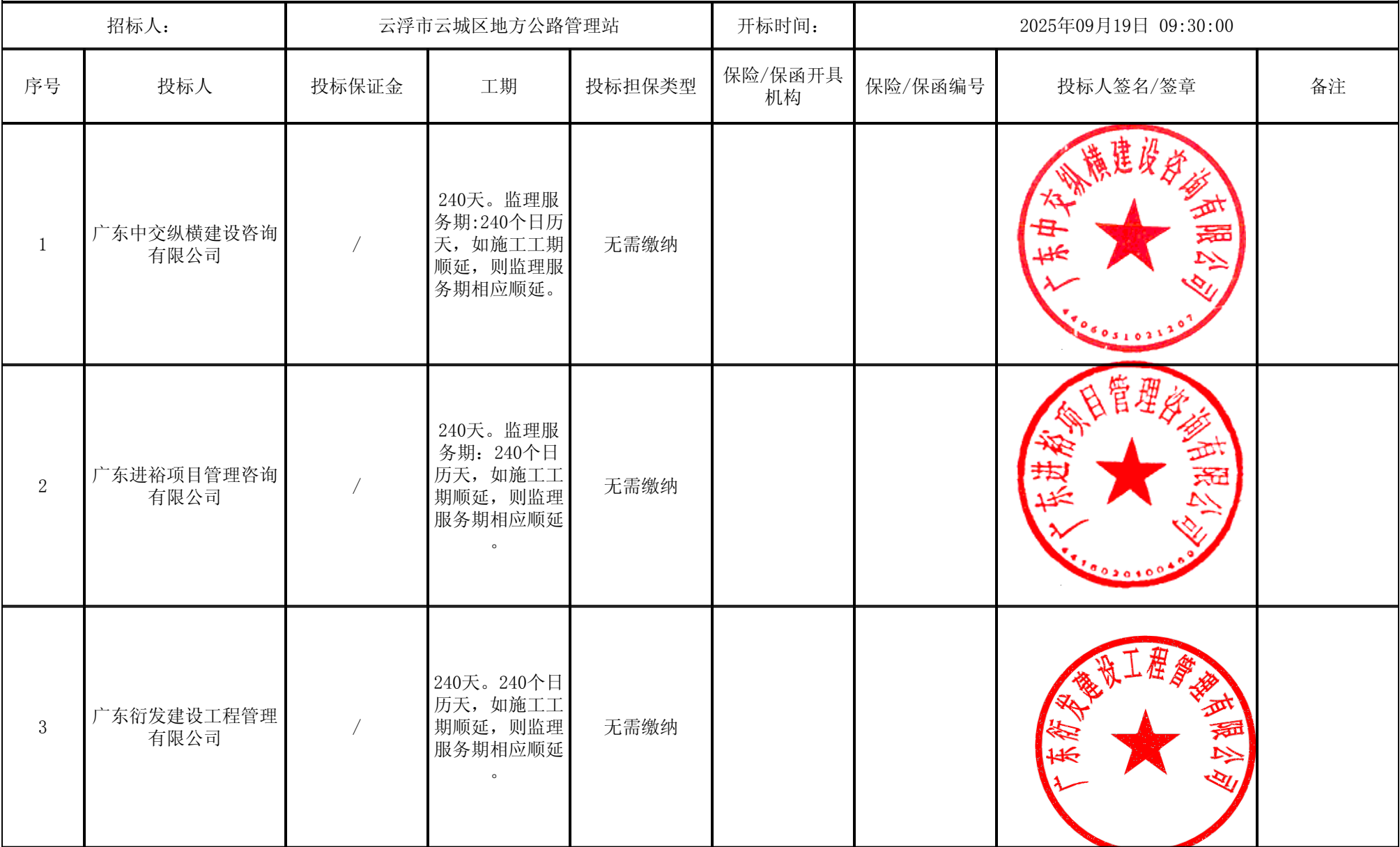
云城区省道S276思劳镇云初村委段连接线工程（监理） 开标记录表