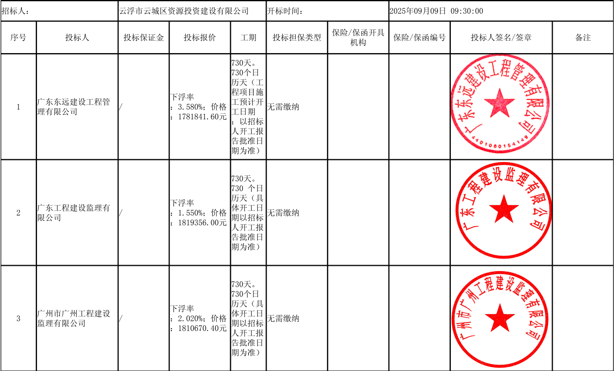
云城区高质量发展公共基础设施项目监理 开标记录表