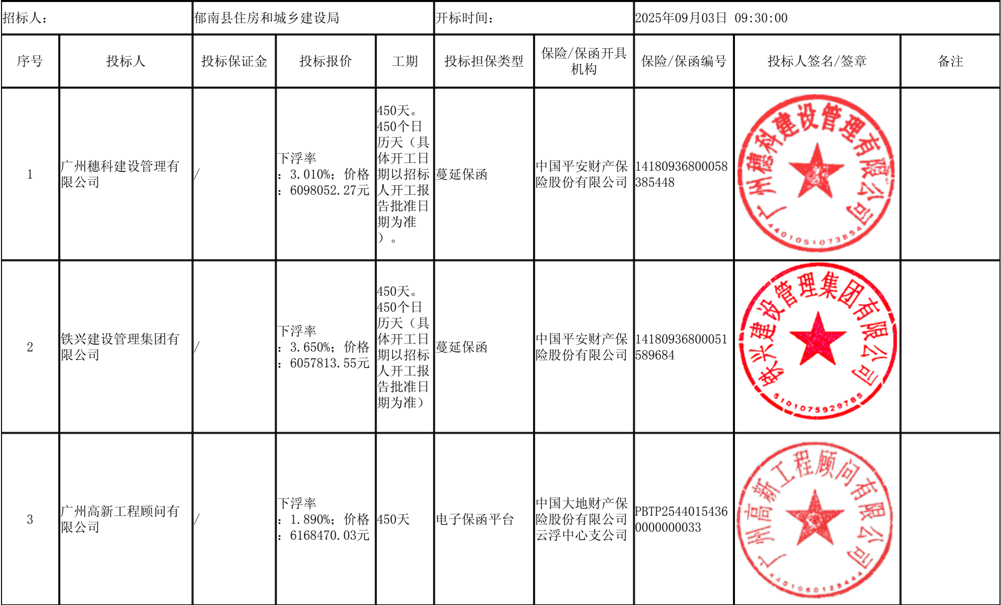
郁南县农村人居环境整治提升工程监理 开标记录表