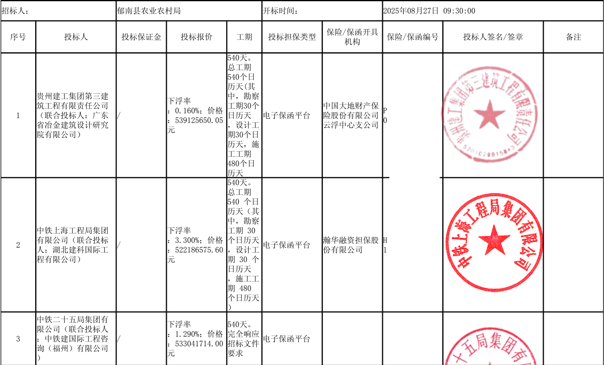
郁南县“百县千镇万村高质量发展工程”典型村建设项目-勘察设计施工总承包 开标记录表