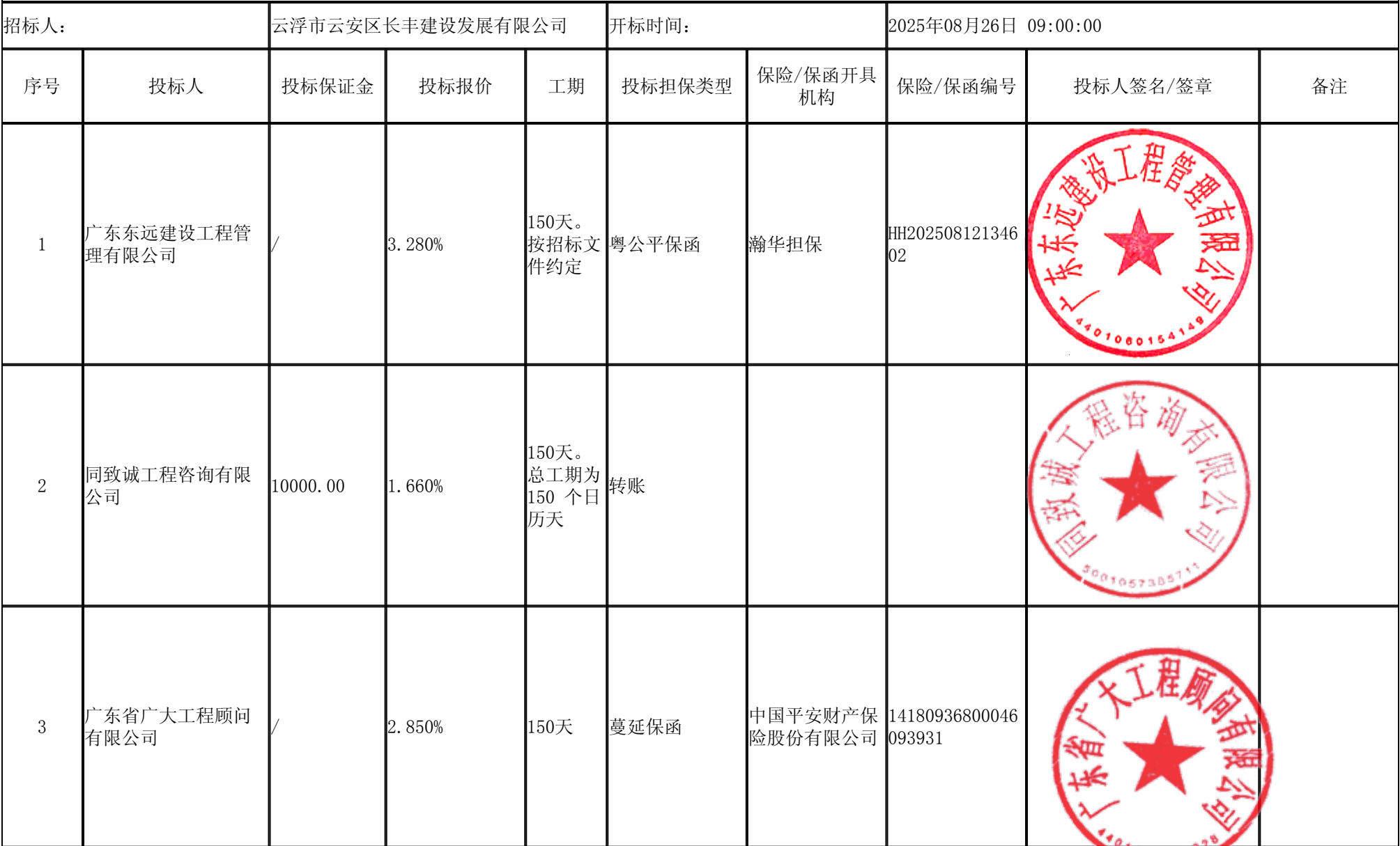
云浮市云安区农村生活污水治理工程项目（监理） 开标记录表