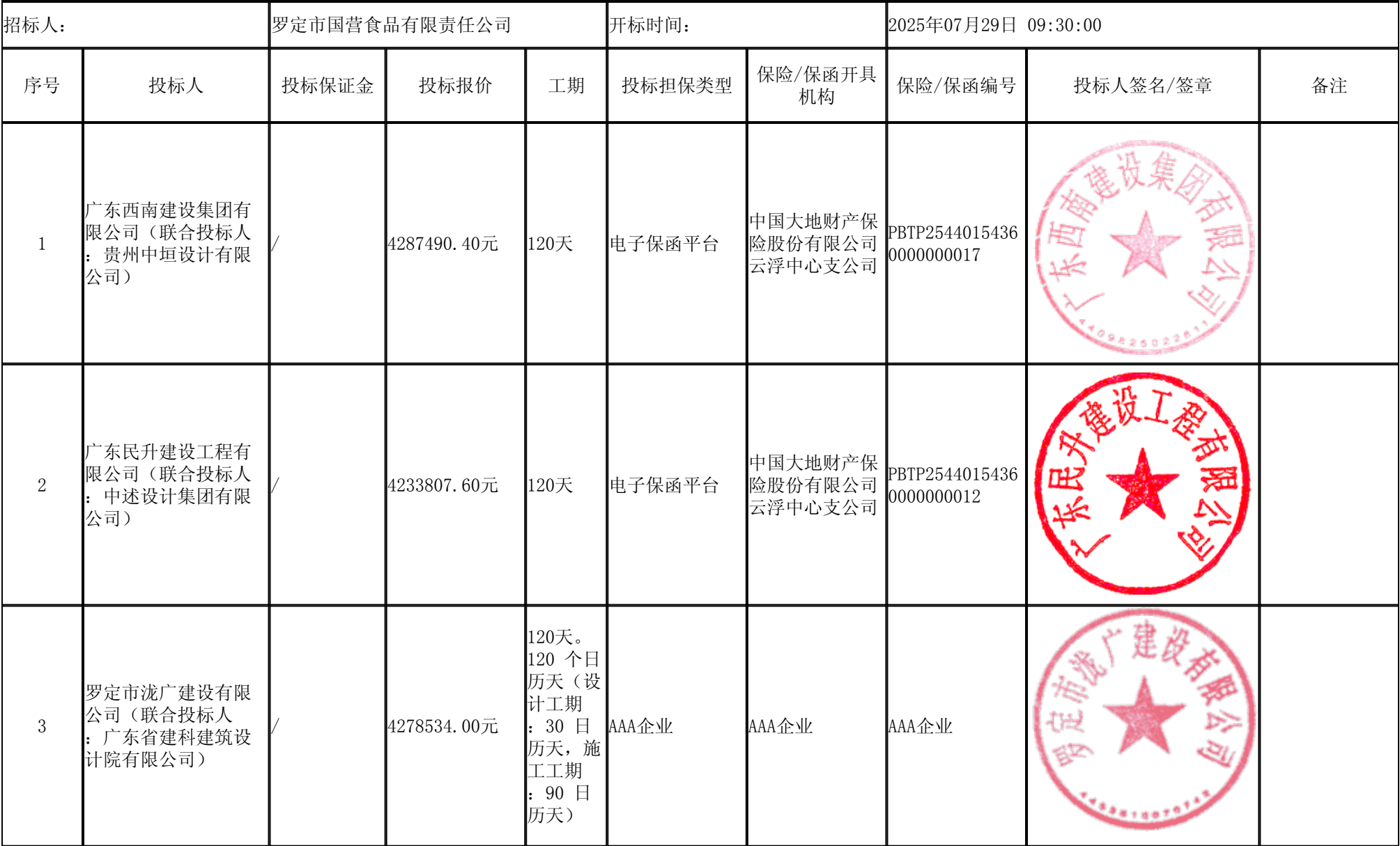
广东省罗定市食品企业集团公司肉类联合加工厂升级改造项目（设计施工总承包） 开标记录表