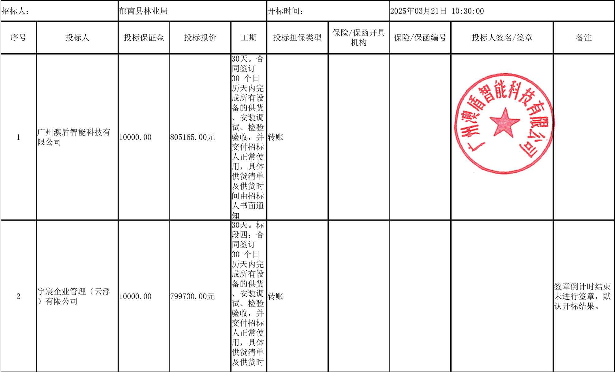
标段四：（小型无人机、载重无人机） 开标记录表